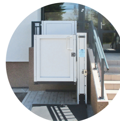
Minimální nároky na stavební úpravy