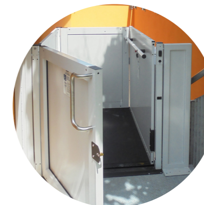
Vysoká bezpečnost provozu