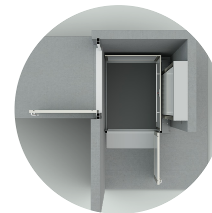
Vstup „přes roh“ (90°)