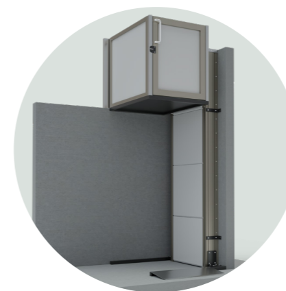
Výška zdvihu až 3 m

Spolehlivý, elegantní design za příznivou cenu