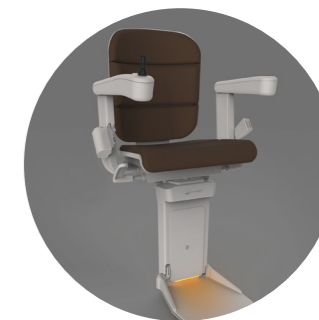
Podnožka s osvětlením