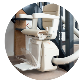
Automatické sklápění podnožky