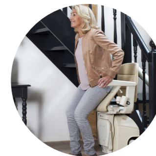
Pomoc při vstávání