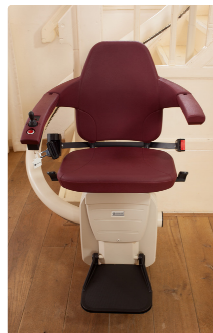
Výběr barev potahu i tvaru sedačky